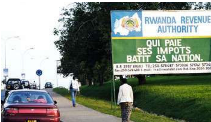
Campagne d'affichage à Kigali, en 2007.

Pour financer son développement de façon autonome, le continent doit revoir ses politiques de prélèvements. Particuliers, entreprises et multinationales sont dans le collimateur pour remplir les caisses des États.